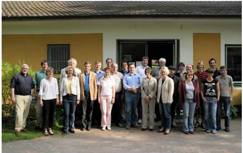
Wir sind augustana!

Der neue Senat der Augustana-Hochschule vor dem Wilhelm-von Pechmann-Haus in der Pause seiner ersten Sitzung: