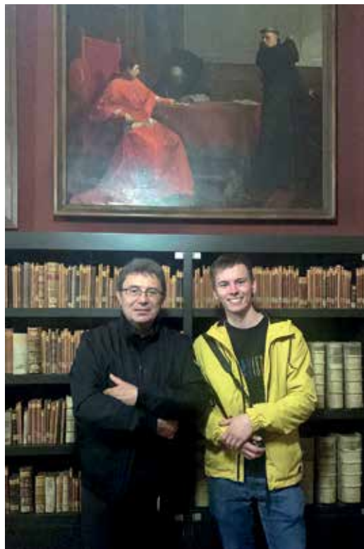
Im Lutherhaus Wittenberg