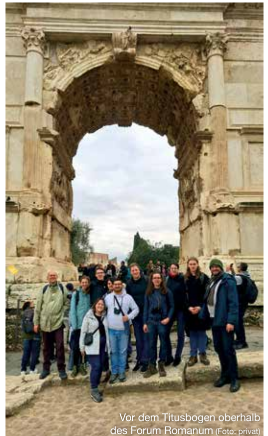
Vor dem Titusbogen oberhalb des Forum Romanum