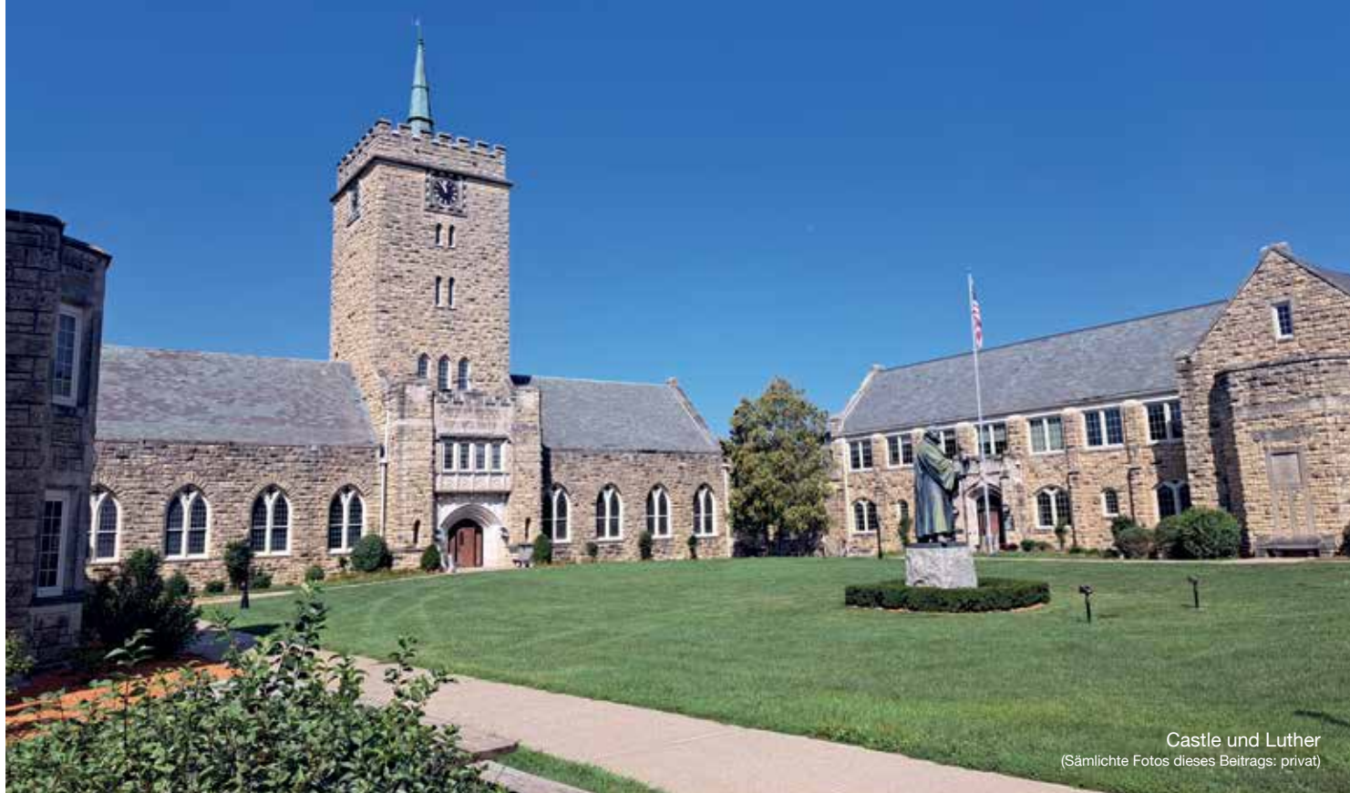
Castle und Luther