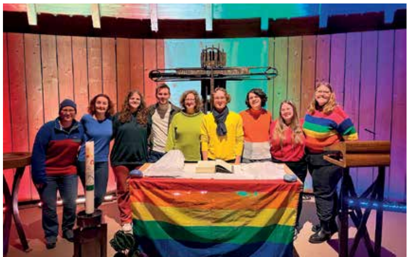
Nikolausabend 2023 (Foto: Augustana-Bildarchiv // Nektarios Saad) | Winterball 2023 (Foto: Augustana-Bildarchiv) | Queeres Abendmahl (Foto: Augustana-Bildarchiv/ Nektarios Saad) | Podiumsdiskussion »Wozu Theologie studieren?« (Foto: Augustana-Bildarchiv/ Nektarios Saad)