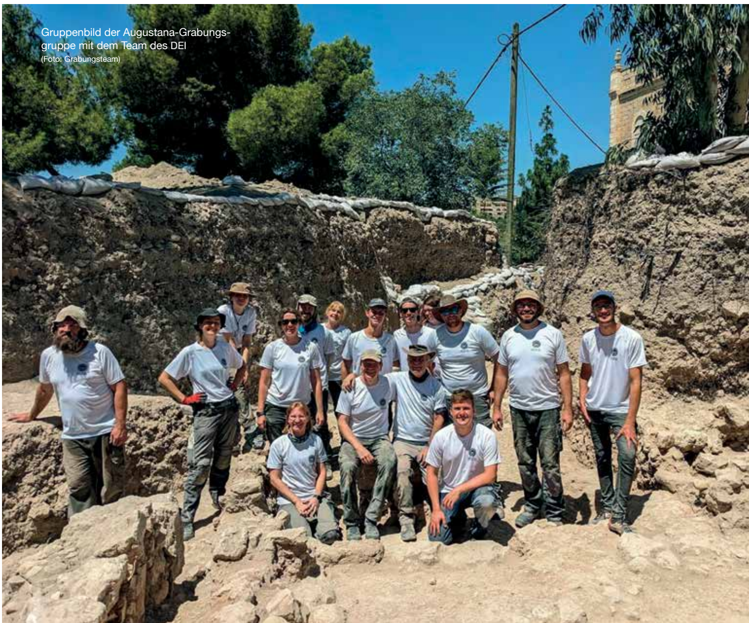
Gruppenbild der Augustana-Grabungsgruppe mit dem Team des DEI