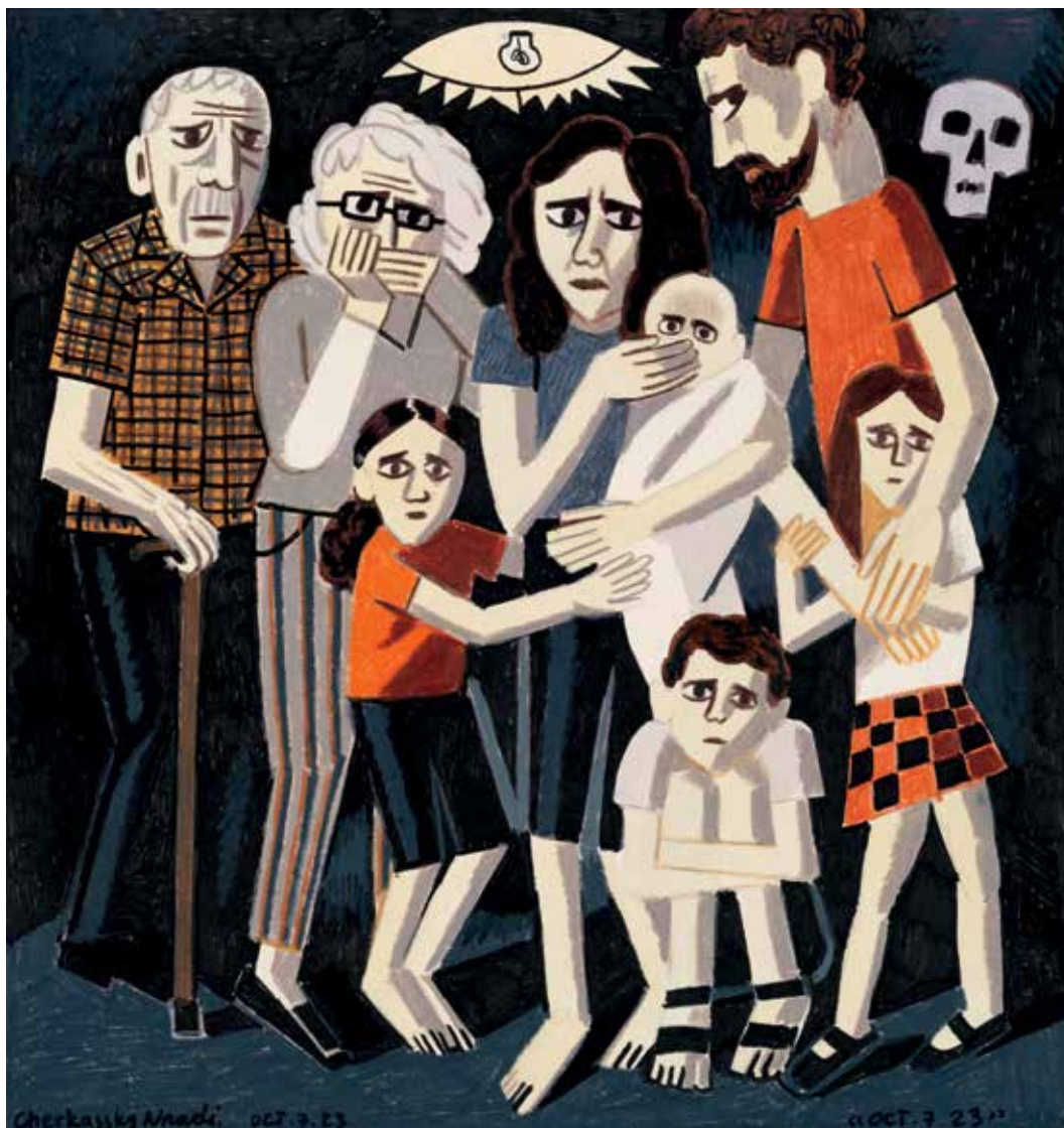
Zoya Cherkassky-Nnadi, October 7, 2023 : Aus der Bilderserie October 7 (2023, Wasserfarbe, Filzstift, Buntstift und Wachskreide auf Papier)

Der furchtbare Krieg in Israel und Gaza vergiftet auch das Klima in Deutschland. Jüdinnen und Juden erzählen von ihrer Angst, weil sie in ihrem Alltag bedroht werden und sich allein gelassen fühlen. Auch muslimische Menschen berichten Ähnliches.