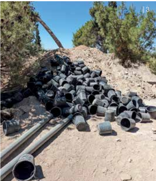
1 Blick über einen der beiden großen »Schnitte« 2 Prof. Pietsch beim Freilegen einer Türschwelle 3 Bei regelmäßigen »Eimerketten« wurden bis zu 200 mit Erde und Schutt gefüllte Eimer aus dem Schnitt nach oben befördert 4 Blick über einen der beiden großen »Schnitte« 5 Mitarbeitende des DEI beim Sortieren der Funde 6 Ein besonders erfreulicher Fund: ein im Ganzen erhaltenes Tongefäß