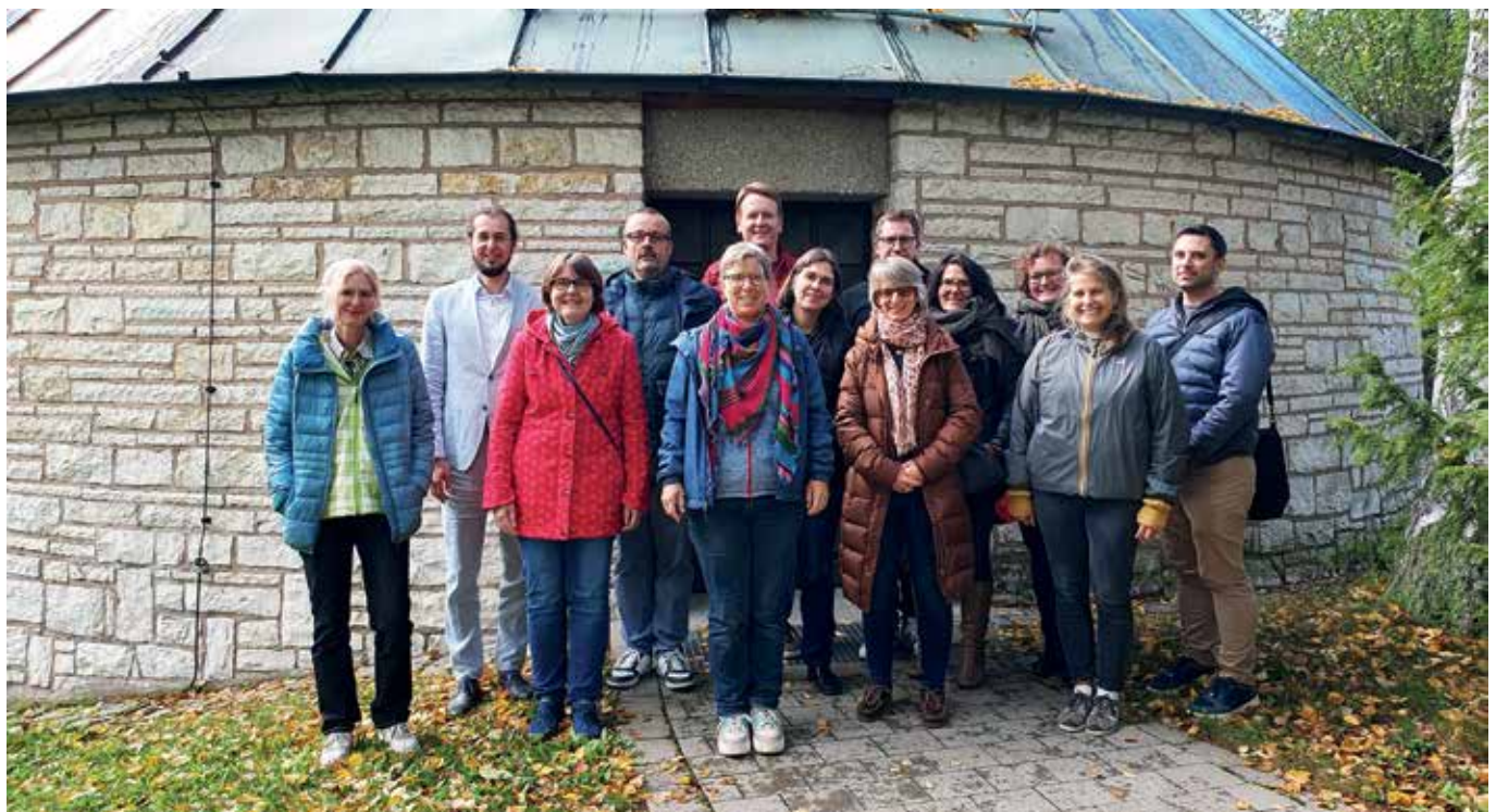
Die Gruppe der Quereinsteiger*innen

Die Initiator*innen des Studiengangs aufseiten des Landeskirchenamtes, die uns willkommen heißen und gut zugeredet haben, haben immer wieder geäußert, dass sie sich von den neuen Studierenden auch eine Veränderung im Stil versprechen, neue Impulse, die das Schöne, Bekannte, das der evangelischen Kirche hierzulande das oben erwähnte freundliche Gesicht gibt,