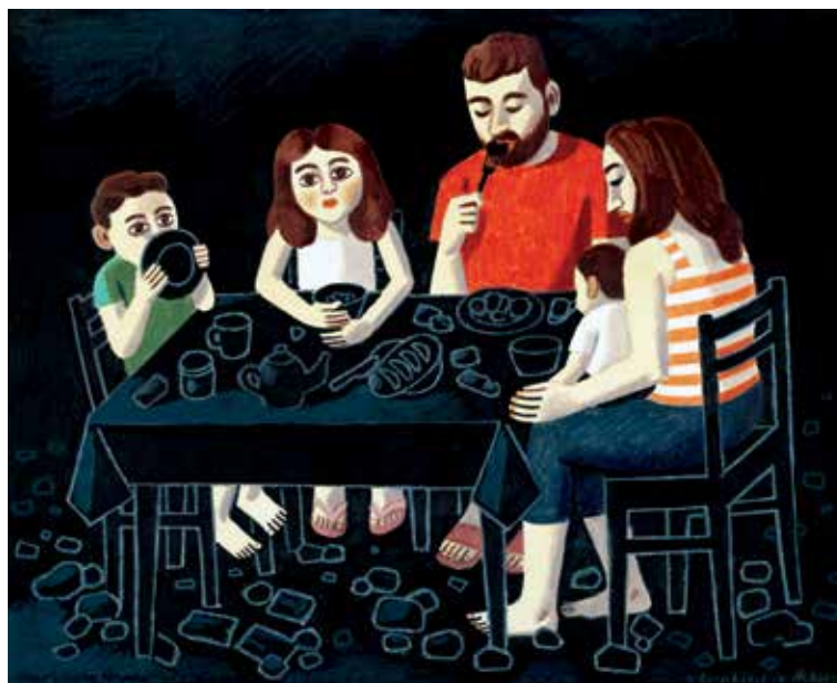
Zoya Cherkassky-Nnadi, Breakfast in Ashes 2023 : Aus der Bilderserie October 7 (2023, Wasserfarbe, Filzstift, Buntstift und Wachskreide auf Papier)

Der Staat Israel und die arabisch-palästinensischen Bevölkerungsgruppen sind seit jeher eine Projektionsfläche für deutsche, christliche und andere Selbstgespräche. Das zeigt sich auch