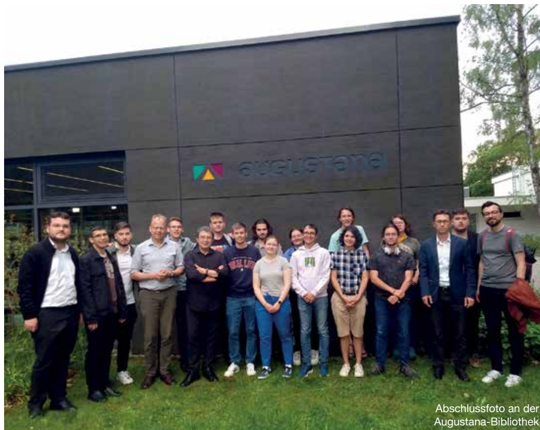
Abschlussfoto an der Augustana-Bibliothek