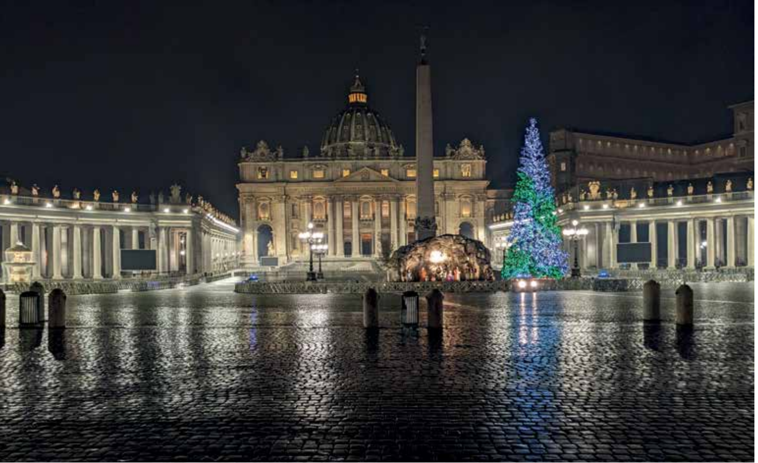
Der Petersplatz in der Neujahrsnacht