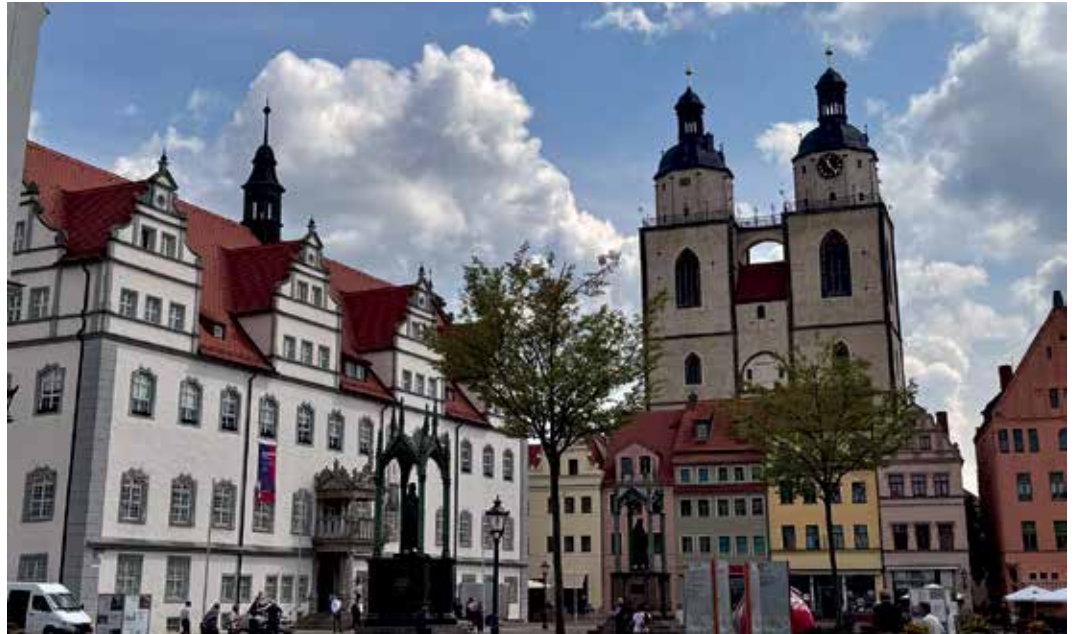
Marktplatz von Wittenberg mit der Stadtkirche St. Marien