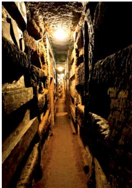
Die loculi der frühen Christen in der Katakomben von San Callisto ■■■ Die Kreuzigung auf der Holztür von Santa Sabina